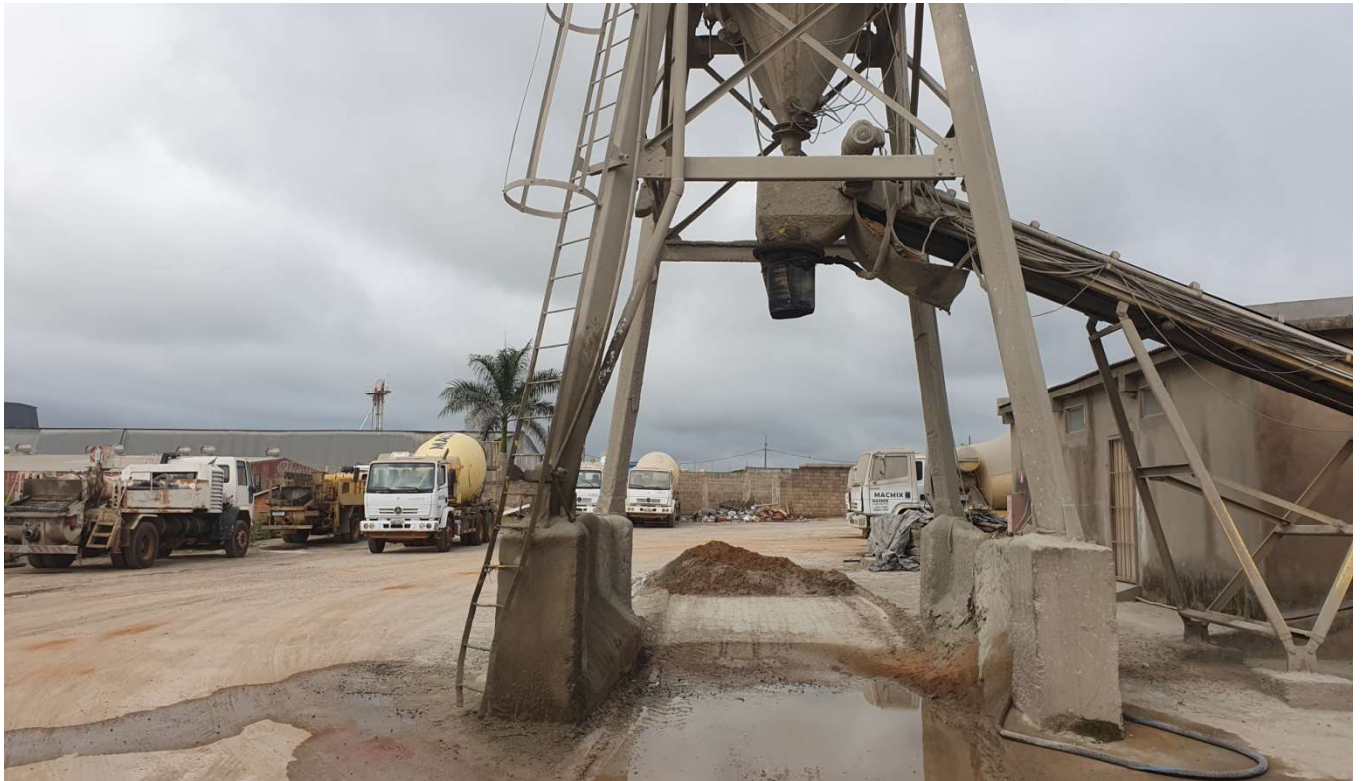
Figura 5: área de carregamento dos caminhões e ao fundo pátio de estacionamento.