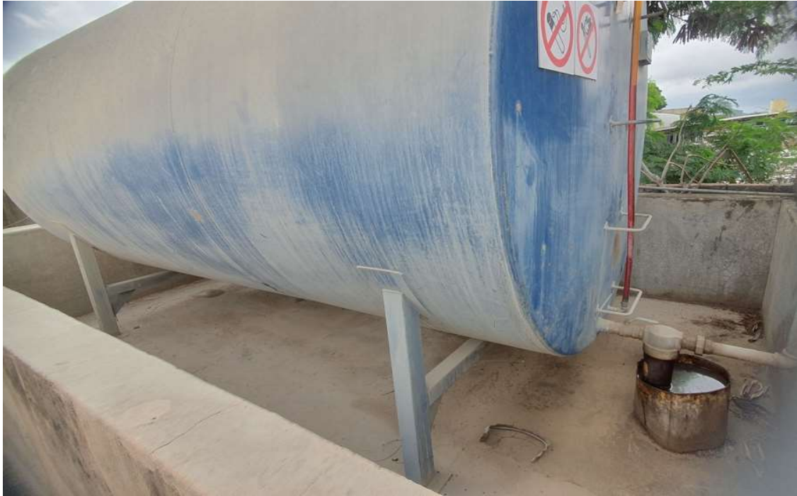
Figura 1: tanque utilizado na propriedade.

Sendo assim o tanque é classificado como não passível de licenciamento por ter uma capacidade inferior a 15 m 3 e por ser utilizado para o abastecimento dos maquinários da empresa.