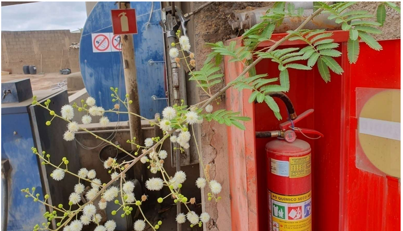
Figura 6: tanque ao fundo e extintor de incêndio.