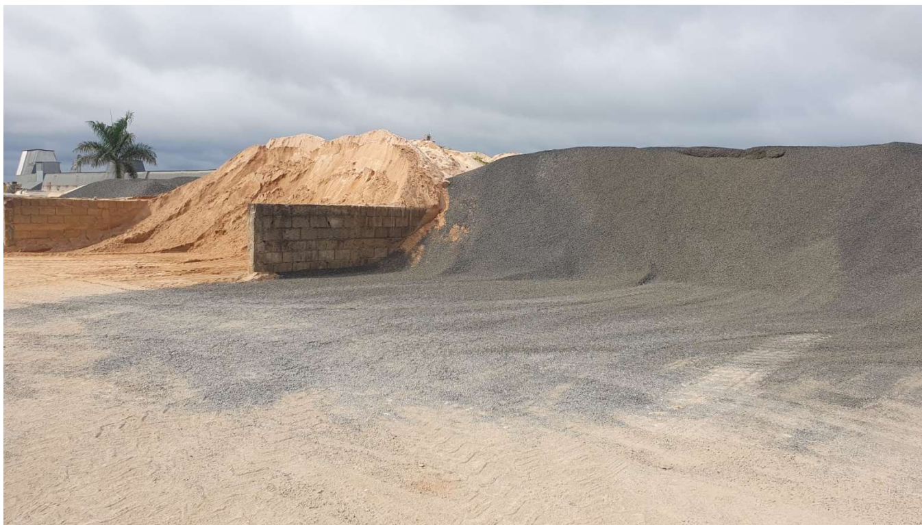
Figura 3: caixa separadora de areia e brita.