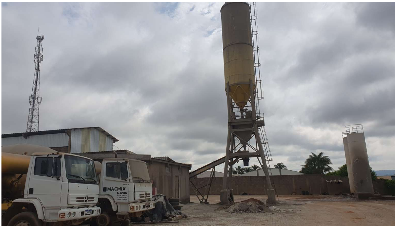
Figura 4: depósito de cimento.